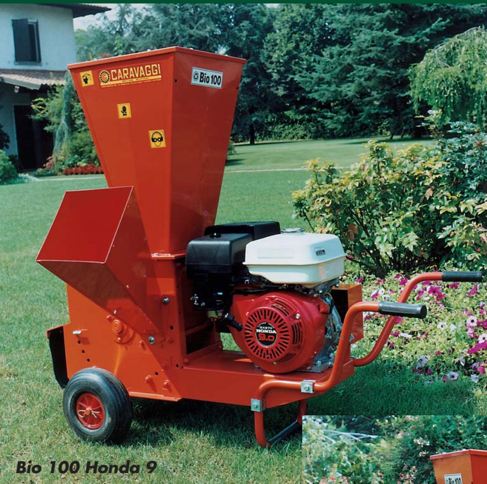
Bio 100 Honda 9