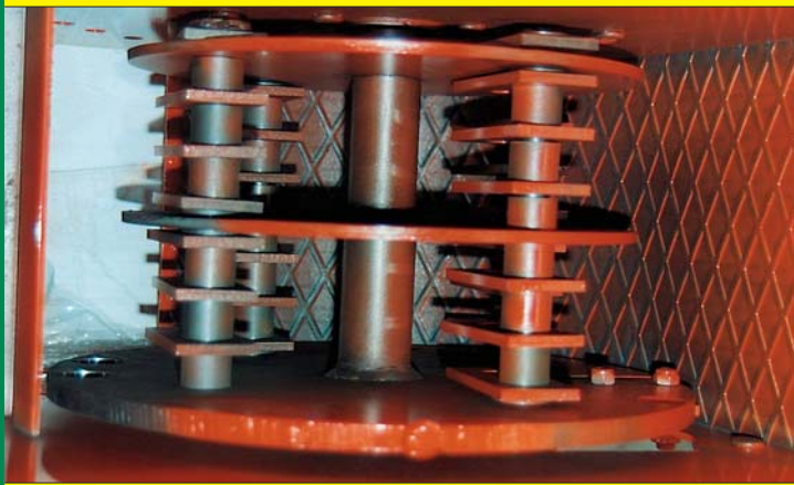
ROTORE A MARTELLI