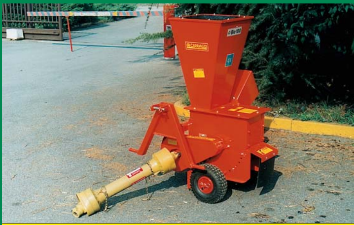
Bio 100 CON ATTACCO TRATTORE