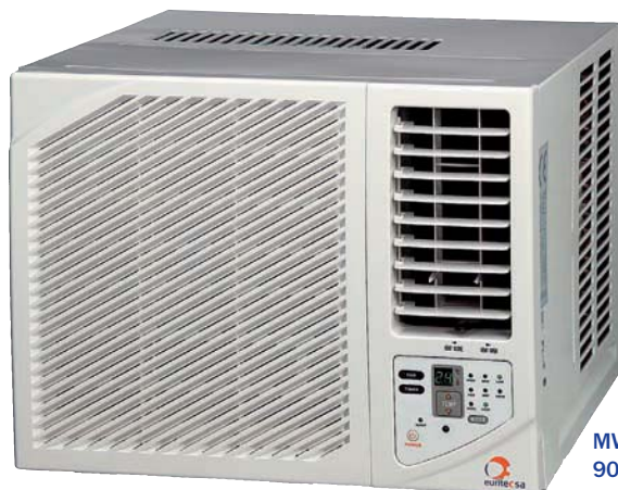
MWF-09 9000 BTU-2.250 Kca/h

Su construcción sólida y robusta, configura un equipo de líneas muy agradables y de notable estética, con unas dimensiones adecuadas a la función y al trabajo que debe desempeñar.