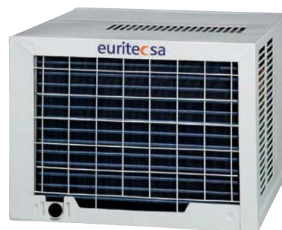
MWF-09 Vista Posterior