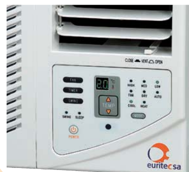
Panel de Mandos