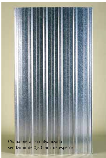
Chapa metálica galvanizada sendzimir de 0,50 mm. de espesor.