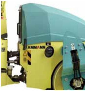
Tanque diesel con candado de serie