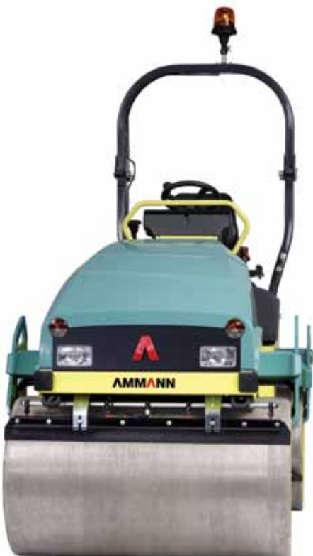
Eje ajustable del tambor de hasta 40 mm

Los rodillos vibratorios combinados ARX12 – 20 se distribuyen por defecto como modelos totalmente al ras con doble tracción y doble vibración. Esta característica permite al tambor compactar a ras de muro eliminando la necesidad de ajustes de precisión con equipo adicional.