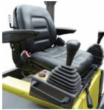
2 palancas de conducción