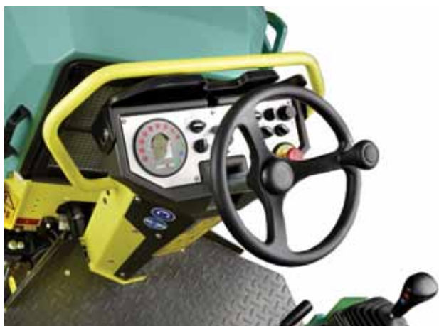
Mando de control intuitivo