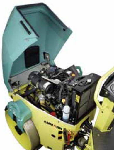
Capota amplia que permite acceso total al motor