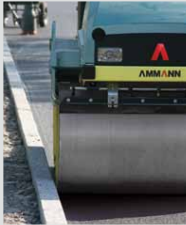
ARX2-4 - tambor regulable