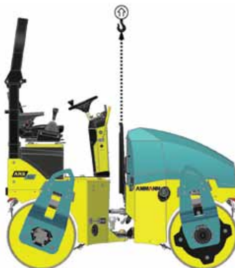
Punto central de carga ARX1 (de serie) ARX2 (opcional)