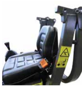
ROPS plegables para fácil transporte