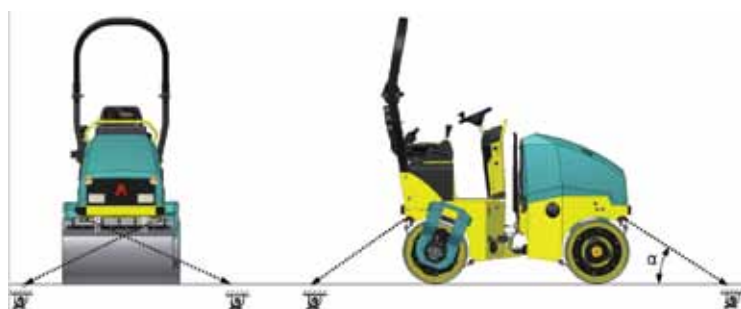
4 cuatro puntos de remolque de sujeción para transporte