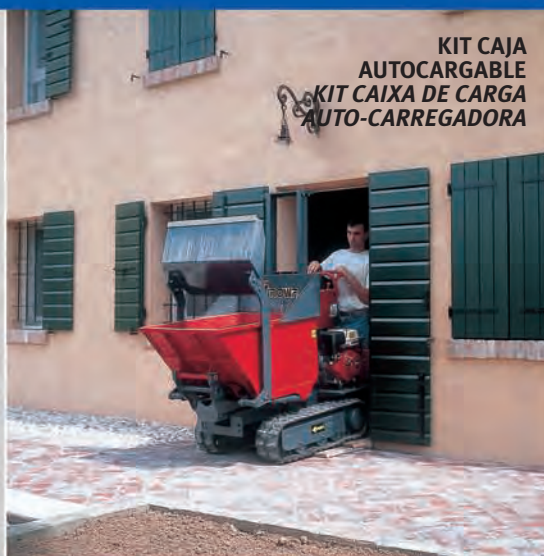
KIT CAJA AUTOCARGABLE KIT CAIXA DE CARGA AUTO-CARREGADORA