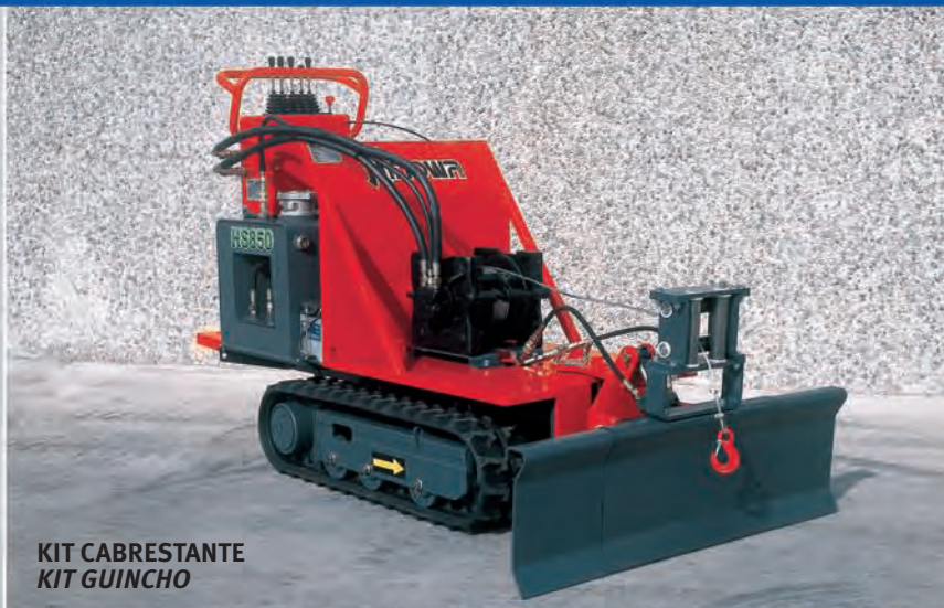
KIT CABRESTANTE KIT GUINCHO