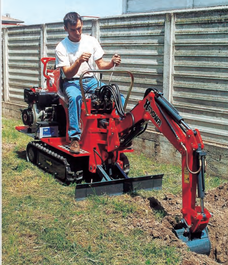
KIT MINIEXCAVADORA KIT MINI-ESCAVADORA