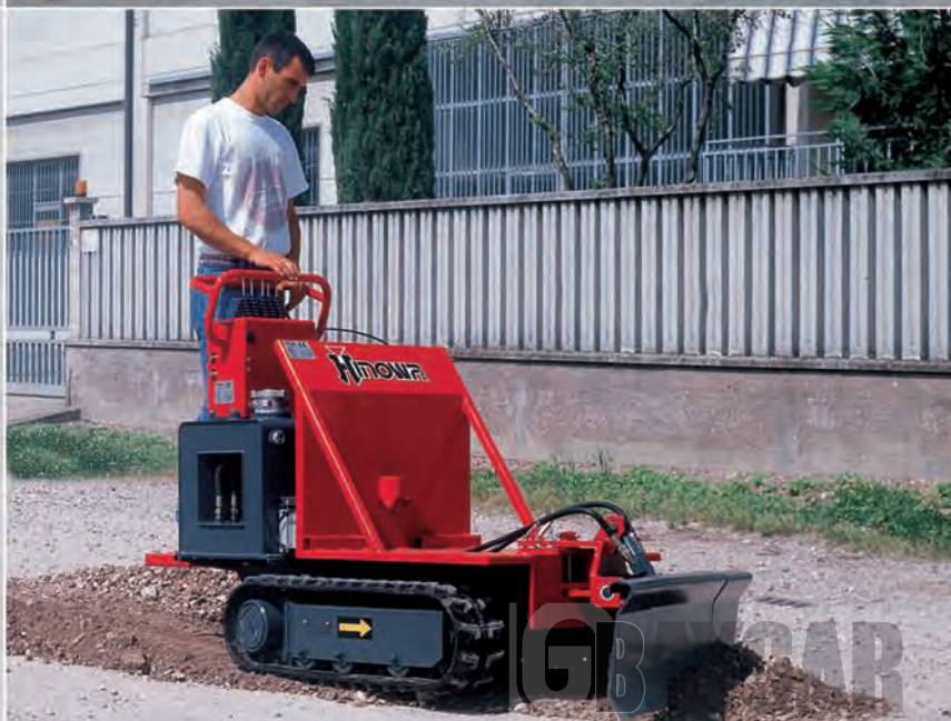
KIT HOJA NIVELADORA KIT LÂMINA NIVELADORA