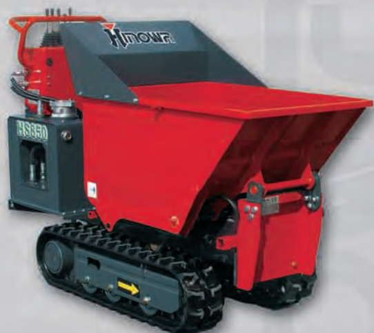
KIT CAJA PARA OBRA KIT CAIXA DE CARGA PARA MATERIAIS DE CONSTRUÇÃO