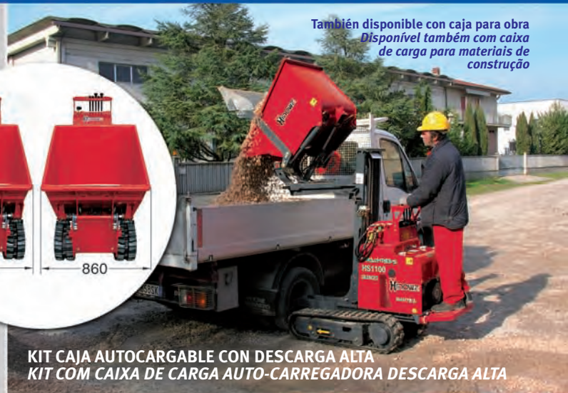
KIT CAJA AUTOCARGABLE CON DESCARGA ALTA KIT COM CAIXA DE CARGA AUTO-CARREGADORA DESCARGA ALTA

También disponible con caja para obra Disponível também com caixa de carga para materiais de construção