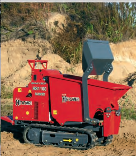
KIT CAJA AUTOCARGABLE KIT CAIXA DE CARGA AUTO-CARREGADORA