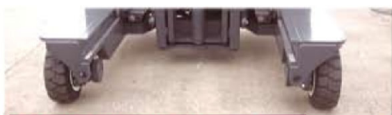
Modo Frontal Adelante / Atrás